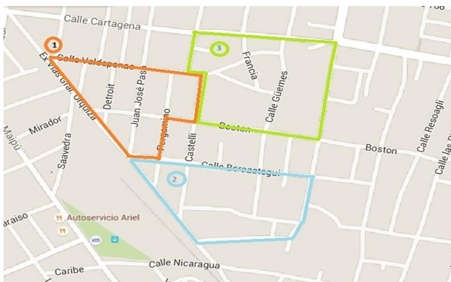
Imagen 5: zonas 1, 2 y 3 entre los barrios Ongay y Paloma de la paz. Año 2016.

- La zona 3 es el espacio más cercano a la laguna más grande (que ya fue rellenada y que era considerada desagüe natural de las lluvias), considerada peligrosa, se encuentra más arriba que la zona 1 y tiene vínculos más estrechos con la zona 2. Ambas zonas comparten rasgos respecto del tipo de vivienda y de las ocupaciones, los niveles de desempleo y otros datos demográficos de los que la zona 1 se ve un tanto alejada. La zona 3 corresponde al barrio Paloma de la Paz, propiamente dicho y al sector de “los caracoleros” llamado así por la laguna usada para la cría de cerdos de parte de la familia de José Navarro.