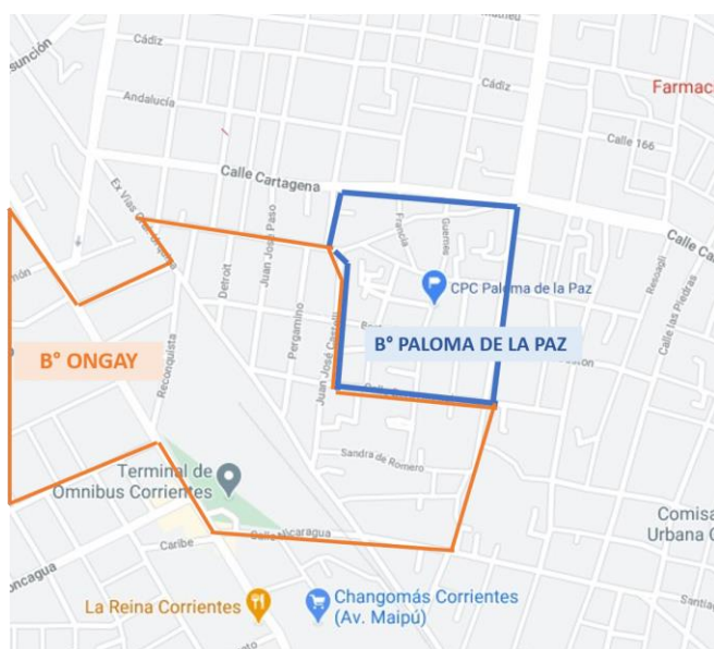
Imagen 1: Barrios Ongay y Paloma de la Paz. Fuente: elaboración propia en base a Google Maps. Año 2021.

dos barrios según la ordenanza catastral del municipio de la capital correntina. En el mapa 1 10 vemos como Villa Ongay 11 se extiende más allá de la avenida Maipú y de la terminal de ómnibus a la que se accede por ella (Ordenanza catastral 578/72). Sin embargo, la zona donde se realizó este estudio sólo comprende el barrio Ongay desde la calle Ex vías, es decir detrás de la terminal, una porción de este barrio que limita con el Paloma de la Paz y que pertenece al gran complejo La Olla (denominado así por PROMEBA en la planificación de su intervención) una zona comprendida por los barrios Ongay, Paloma de la Paz, Serantes, Irupé y San Jorge, que se conoce desde el municipio como el territorio de asentamientos informales más grande de la ciudad (imagen 2). Este territorio es el intervenido por PROMEBA y no exactamente, el barrio Ongay en toda su extensión.