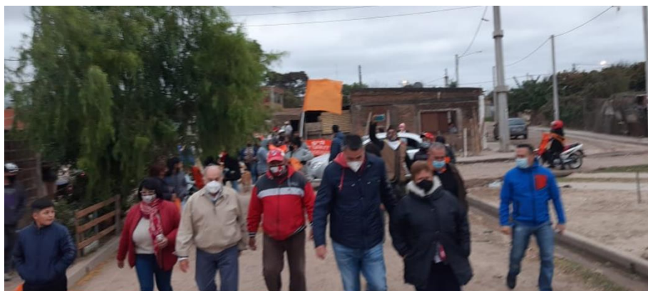
Imagen 6. Caminata junto al representante del PANU. Campaña electoral 2021.

En este sentido, encontramos que frecuentemente se resuelven, de modo particular y privado (llamando por teléfono, por ejemplo), algunas necesidades mínimas que se presentan en el territorio. El conocimiento de los referentes respecto del universo político, con sus historias familiares, diferentes cargos y vínculos entre ellos, es admirable. Recuerdan tiempos del barrio en función de las gestiones políticas y con ello reconstruyen los avances y los logros en la comunidad. Entonces, continuamente, encontramos que ordenan los sucesos que atañen a la comunidad en función de quienes administraban los diferentes niveles estatales, municipio, provincia y sus ministerios o secretarías. En el caso de Mártires, conoce también a agentes de la policía provincial de su camada y otros, lo que le colabora al momento de revisar situaciones de inseguridad. Los vínculos de proximidad con agentes de la administración del Estado provienen de historias de vida particulares, al menos, en los casos rastreados de Mártires y José Navarro.