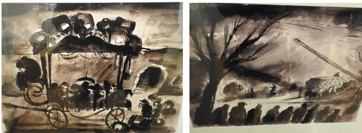
36 y 37. Dibujos expuestos en el Museo del Gueto de Terezín. Fotos: Cecilia Vallina, (2017).

cada uno de esos espacios durante la ocupación nazi, nuestra guía nos condujo a una sala, nos invitó a ver una “película” que corría en loop y se despidió. Su trabajo había terminado.