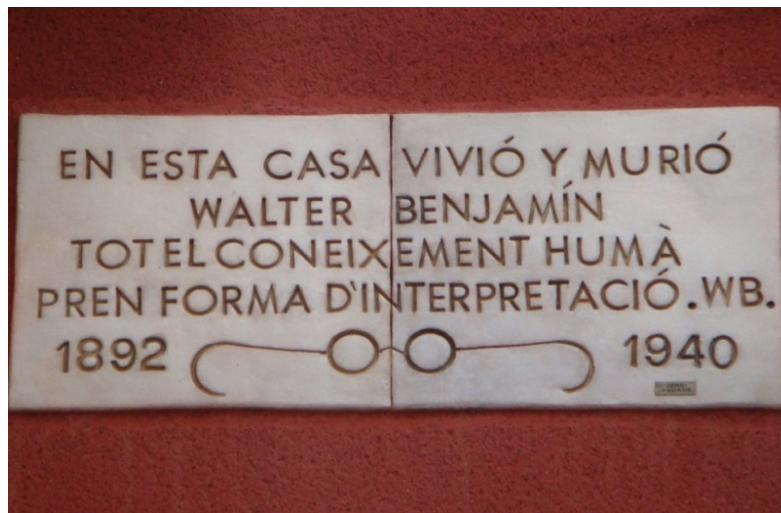
4. Placa recordatoria colocada en el frente de la casa de Port Bou, en España, donde Walter Benjamin murió. La cita escrita en catalán dice “Todo el conocimiento humano es una forma de interpretación”.

Luego de este recorrido para comprender por qué las imágenes siempre están en plural, indagar la genealogía filosófica de la expresión la experiencia de la mirada y abrir la vía de la imaginación –paso necesario para construir la propia y trabajar el enlace entre ambas–, poner en valor la potencia teórica y crítica de un saber que complejiza los modelos de temporalidad y actualiza nuestra perspectiva interdisciplinar, nos proponemos ahora, en compañía de la estela de Martín-Barbero, continuar investigando e interrogando un conjunto de categorías que Didi-Huberman despliega con diferentes intensidades, enlaces y matices en su obra. Tomamos entonces la potencia que nos irradia su pregunta ¿cómo volver sensible el tiempo en las imágenes? Dejarnos afectar por la pregunta supone al menos dos movimientos: desestabilizar los enmarques teóricos heredados y disponernos a la experiencia de nuestra propia mirada.