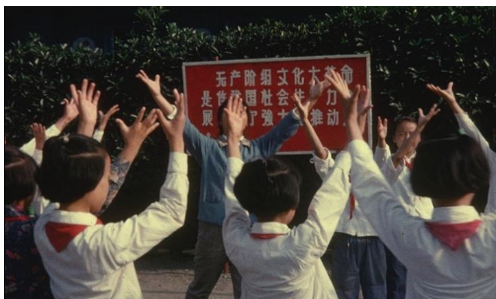
41. Fotograma de No intenso Agora (2010). Una imagen de la filmación del viaje de la madre de Salles a China en 1966.

Salles acorta la distancia temporal e íntima con su madre a través de las imágenes, un medium para acercarse y comprenderla, para sentir algo de lo que ella, una mujer de treinta y siete años en un viaje mundano y fascinante, experimentó.