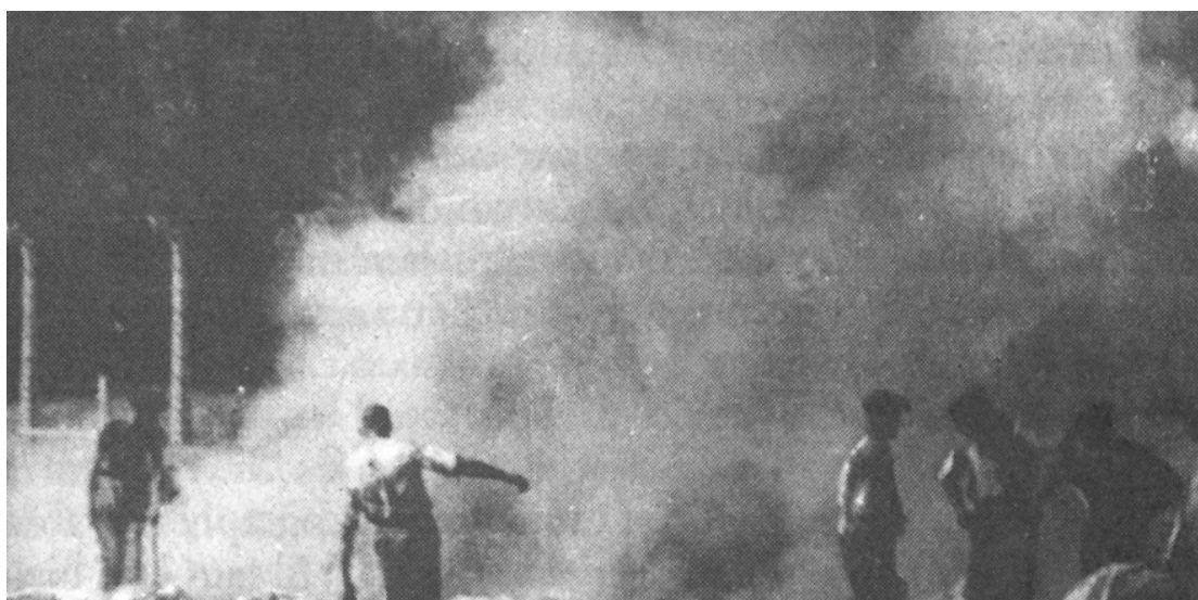
6. Documento tomado por los Sonderkommando.

La secuencia de las cuatro fotos formó parte de la itinerancia local de la muestra, cuya primera versión fue exhibida en el museo Jeu de Paume, en París, que incluía obras de Argentina. La atención periodística se posó en la historia de las cuatro fotos para presentar al investigador francés. El diario Clarín publicó una nota con esta imagen y pie de foto para promover la muestra: