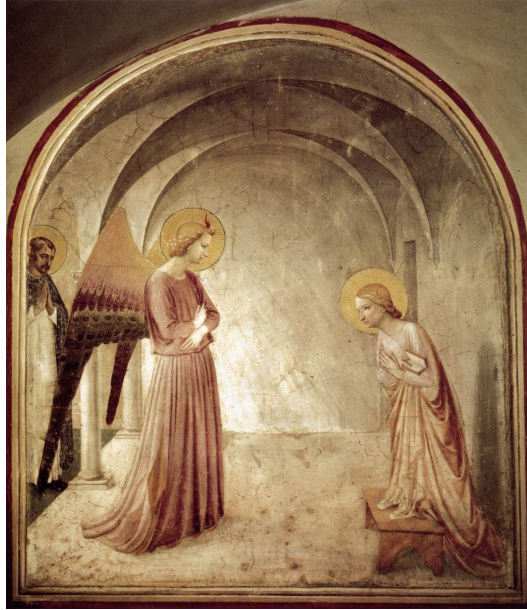
2. Fra Angélico, Anunciación , hacia 1440-1441. Fresco. Florencia, Convento de San Marcos.

Ese pasaje que va de la inmovilidad –de una iconología que analiza los motivos visibles o de una semiología que opera dentro de un sistema de signos estáticos– a la movilidad dentro de las formas visuales, terminará por encontrar una vía de apertura recién cuando sea la propia mirada de Didi-Huberman la que realice un descentramiento y se detenga, en ese mismo convento renacentista, en otra imagen que lo llevará a desplegar su análisis de la temporalidad.