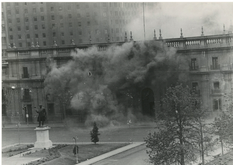
26. Fotografía de la fachada en llamas del Palacio de La Moneda el 11 de septiembre de 1973. Exposición permanente. Museo de la Memoria y los Derechos Humanos. Fondo La Nación (Chile)/ UDP.

Para interrogar las huellas de la historia en las superficies de inscripción del orden simbólico que nuestra mirada ha naturalizado y detectar allí un síntoma visual es preciso inscribir el tiempo en las imágenes. Descomponer las máscaras del tiempo que se nos presentan plenas –las mismas que invocaba Foucault–, como vía de acceso a la temporalidad heterogénea que las habita.