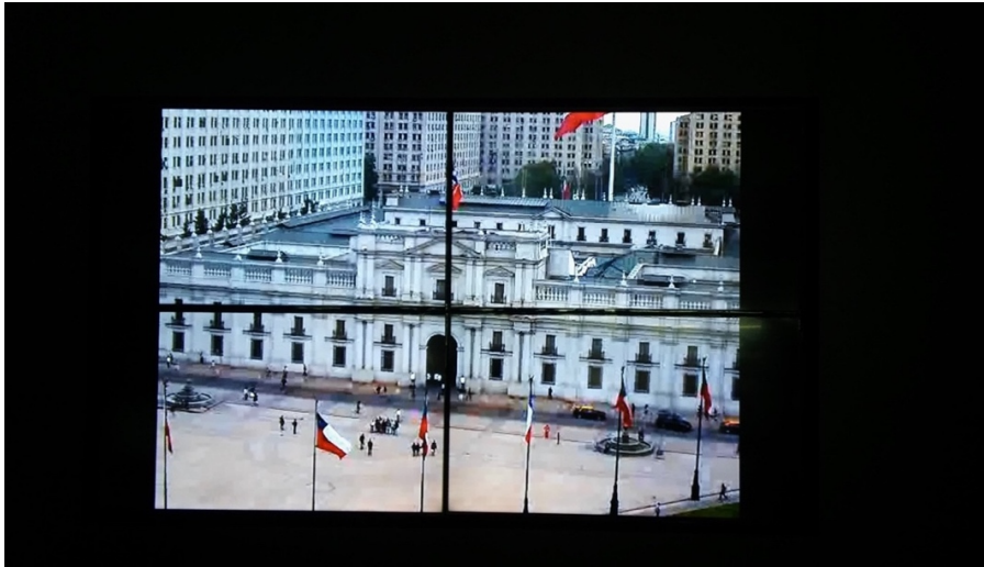
25. “La Moneda online” (2016), instalación compuesta por cuatro pantallas ubicada en la Sala Once de septiembre. Se presenta al público como la vista de una cámara fija ubicada frente al Palacio de La Moneda que transmite en vivo las 24 horas del día durante todo el año. Museo de la Memoria y los Derechos Humanos de Chile, Santiago de Chile. Foto Cecilia Vallina, 9 de enero de 2018.