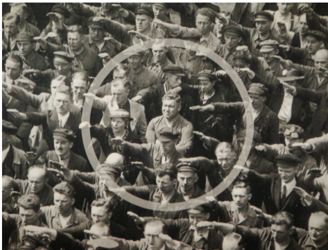
10. Fotografía que integra la sección “El nacionalsocialismo sube al poder” de la exposición permanente Topografía del Terror. La Gestapo, las SS y la Oficina Central de Seguridad del Reich , en el Centro de Documentación “Topografía del terror”, Berlín, 2010.

Leído desde el síntoma, el gesto que aflora en la imagen como una intensidad visual es la irrupción de una memoria sepultada que emerge de un nudo de anacronismos y de su entrelazamiento de tiempos heterogéneos, el sustrato en el que trabaja la memoria. El síntoma freudiano le ofrece a Didi-Huberman un dispositivo temporal en el que el tiempo se desmonta , al estar formado por una “colisión” de temporalidades heterogéneas. Mirar una imagen desde el síntoma visual permite entonces detenerse a interrogar un gesto, una falla menor, una miniatura desestimada que abre una pregunta en la historia. ¿Cuál sería una de las tantas preguntas posibles ante esta imagen?