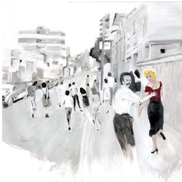
32. Marilyn y mi papá . Óleo. Florencia Garat, 2016.