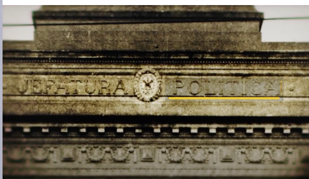
El edificio se inauguró en 1916. Debajo de la cuadriga romana que emula la Puerta de Brandeburgo de Berlín se lee: Jefatura Política. Manifiesta señal de que allí se alojaba el poder político de la provincia en la ciudad. 20. 21. Captura de pantalla de La arquitectura del crimen (2016) y Reconstrucción Parte 1 (2019).