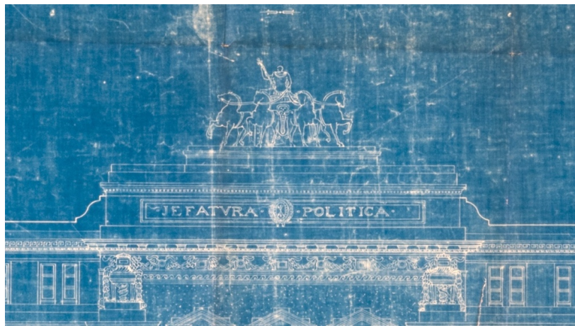
19. Imagen de un detalle del plano del edificio de la Jefatura Política de la provincia de Santa Fe en la ciudad de Rosario diseñado por el arquitecto Manuel Torres Armengol. En el frontispicio ubicado en el ingreso de calle Santa Fe se lee: Jefatura Política. La función proyectada para el nuevo edificio sería tallada en piedra como símbolo de su destino. La construcción comenzó en 1909.