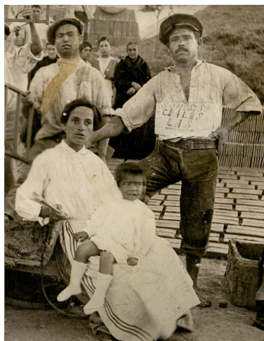
29. Allí se lee, escrito a mano: “Somos socialistas”.

Un dispositivo que resignifica los recorridos de esa imagen, desde el fondo de una caja de lata a un presente dispuesto a exponerla, interrogarla y producir, a su vez, un texto para ser leído y generar que otras miradas se asomen a esa vieja fotografía ajada que contiene el tiempo del acontecimiento y el tiempo de la espera. Aquí entra en juego una mirada que dialectiza los extremos del tiempo para entrelazar las memorias que se transmitieron en esa familia, la de ese abuelo, esa madre, este nieto que recupera el gesto de resistencia íntima y lo entrega a otras miradas para que lo conviertan en una memoria cultural y política compartida. El nuevo relato tiene la tarea de activar en el presente una transmisión que va más allá de la memoria familiar. Quien lo escribe y quien lo lee es un tercero, alguien que no pertenece a esa familia y que recoge esos testimonios, mira esas fotos, recupera esas memorias y las pone en juego en una narración que las resignifica y tensa su propio presente. La presentación de la imagen y la exposición de sus tiempos anacrónicos convoca nuestra mirada y abre nuevas relaciones entre las distintas temporalidades.