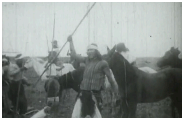
33. Fotograma de la secuencia de El último malón (1917) que aparece en el capítulo “Campaña del desierto” (2007) entre el 19’42 y el 19’52, realizado por Canal Encuentro. (Link https://bit.ly/historiadeunpaís )

temporalidad heterogénea de las imágenes que durante décadas representaron la memoria de una derrota y se recuperó, no solo la memoria de la rebelión moquito, sino la posibilidad de interpelar su potencia política en este presente. Un tipo de tensión que nos remite al análisis que ofrece Didi-Huberman de El acorazado Potemkin de Eisenstein, cuando señala la “potencia dinámica” de las escenas que exponen las “emociones colectivas” de la sublevación convirtiendo el pathos de esa “masa”, de ese “pueblo en lágrimas” que se levanta, en una dimensión política (Didi-Huberman, 2016, p. 201).