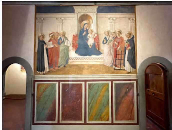
3. Virgen de las sombras, 1450, hacia 1440-1450. Fresco. Florencia, Convento de San Marco. En la parte inferior se ven los frescos que analiza Didi-Huberman en Ante el Tiempo .

Ese pasaje que va de la inmovilidad –de una iconología que analiza los motivos visibles o de una semiología que opera dentro de un sistema de signos estáticos– a la movilidad dentro de las formas visuales, terminará por encontrar una vía de apertura recién cuando sea la propia mirada de Didi-Huberman la que realice un descentramiento y se detenga, en ese mismo convento renacentista, en otra imagen que lo llevará a desplegar su análisis de la temporalidad.