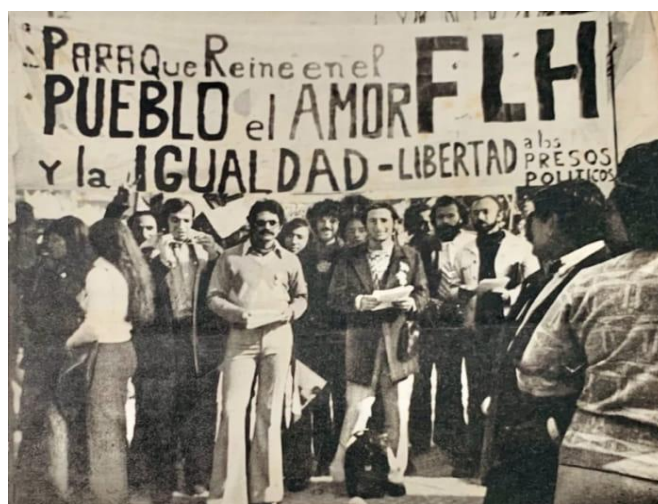
43. Fotografía publicada en la portada del N° 891 de la Revista ASI incluida en el documental Sexo y revolución (2020). Fue tomada el 25 de mayo de 1973, cuando el Frente de Liberación Homosexual se movilizó a Plaza de Mayo junto a las distintas corrientes peronistas para celebrar la asunción de Cámpora.

Casi cuarenta años después, la imagen encontró una nueva legibilidad a través de la mirada del director y de los testimonios que reconstruyen su historia, recuperan la potente imaginación política del FLH y vuelven sensibles esta superficie visual en nuestro presente. Fragmento de Sexo y Revolución https://bit.ly/3Pzhy1x