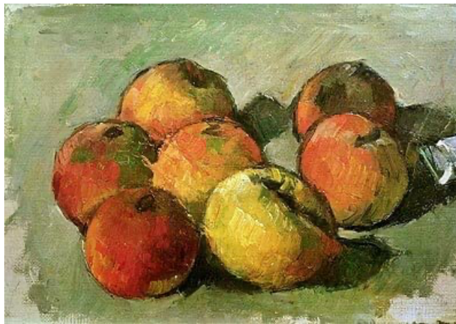
1. Paul Cézanne, Naturaleza muerta con siete manzanas y un tubo de pintura , c.1873/77.

Con distintos matices –se trate de destacar el lugar del color, del movimiento o del transcurso del tiempo–, la lectura de Merleau-Ponty de la obra de Cézanne 8 subraya el valor de la interpelación crítica del pintor a un tipo de percepción desencarnada de las imágenes. “ Vemos la profundidad, la textura, la suavidad, la dureza de los objetos –para Cézanne, incluso– vemos su olor” (Cézanne, 2012, p. 43).