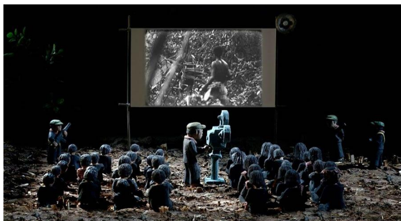
40. Fotograma de La imagen ausente (2013). En la imagen se recrea el momento en que las personas prisioneras de un campo de trabajo son obligadas a mirar películas filmadas por los Jeremes Rojos que conducen la autoproclamada revolución. El propio Panh recuperó y restauró esos registros filmicos para componer su realización.

obligadas a trabajar hasta la extenuación y la muerte en los arrozales, se convierten cada noche en el público de esas películas. Esa era la metodología que practicaban los Jeremes Rojos. Un adoctrinamiento que incluía la obligación de mirar las imágenes de una revolución que había cortado los lazos con una historia impura que debía ser depurada y les exigía olvidar sus nombres y su propio pasado. Pero la operación de Panh no se limita a reproducir la situación de espectadores cautivos. Inscribir esas imágenes en una escena que no fue filmada –una imagen perdida– invierte el régimen de sustracción de un orden de visibilidad que niega la temporalidad subjetiva y colectiva y nos invita, en este presente, a reponer un lazo y devolverles nuestra mirada. La voz en off que sostiene la narración dice: “La revolución que nos habían prometido sólo existe en la imagen. Un film político debe descubrir lo que ha inventado. Por supuesto, no he encontrado la imagen perdida. La he buscado en vano. Ahora les doy esta imagen perdida para que no dejemos de buscarla”. (Link a un fragmento: https://bit.ly/45a76q8 )