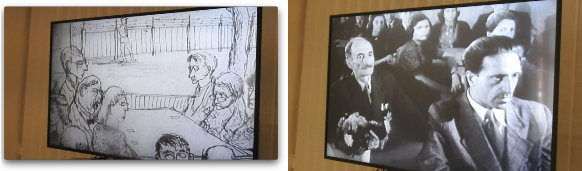
38 y 39. Fotografías de la pantalla con el video exhibido en una sala del Memorial de Terezín. En la imagen 3, se ve uno de los dibujos expuestos en el gueto. En la imagen 4, los prisioneros asisten a un concierto organizado especialmente para ser registrado en el rodaje. Esta imagen pertenece a una de las secuencias de la película El Führer ofrece una ciudad a los judíos , que se incluyen en ese montaje, en el que se alternan imágenes de la película con los dibujos de las personas que estaban prisioneras en el gueto. Fotos: Cecilia Vallina, (2017).

Allí, solos, sentados frente a una pantalla pequeña y sin ninguna mediación previa, comenzamos a ver unas imágenes sobre las que una voz en off refería los números de los trenes que transportaban a las personas judías al gueto y la cantidad de sobrevivientes que hubo en cada convoy. En el material había dos tipos de imágenes: las primeras eran escenas de grupos trabajando, regando las huertas al sol, asistiendo a un concierto, escuchando con atención una conferencia. Las segundas, intercaladas con las anteriores, eran muchos de los dibujos expuestos en las salas del Museo del Gueto de Terezín. (Link a fragmentos del montaje: https://bit.ly/463hEss )