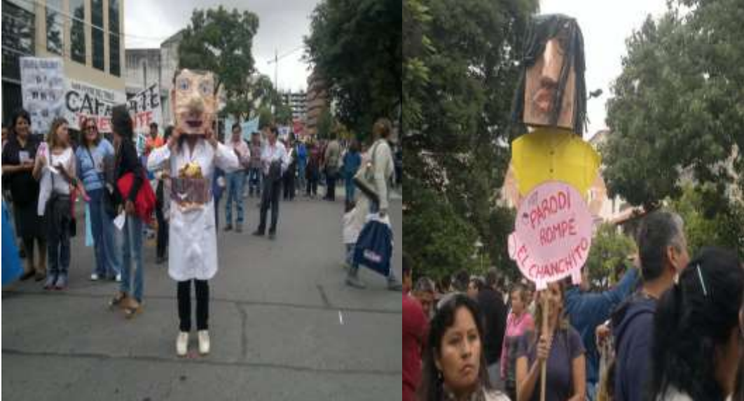
Foto N°20: las mascotas de la marcha de “Docentes Unidos de Salta”: “Juan el porro” y “Parodi rompé el chanchito”. 20 de abril 2014.

Lemas insistentemente repetidos en diversos escenarios fueron “Un docente luchando también está educando” y “Docentes Unidos, jamás serán vencidos”, acompañados de cómicas ilustraciones sobre las autoridades gremiales y de gobierno.