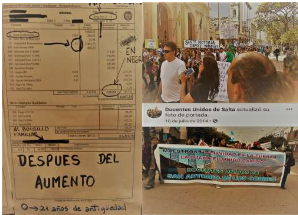
Foto N°19: se colgaron recibos de sueldo en la plaza “9 de Julio”, elaboraron pasacalles con lemas inspirando a la unidad y recrearon escenas de la “Noche de las Tizas”, frente a la catedral de Salta. Abril 2014.

De las cuentas “Docentes Unidos de Salta”, “Prensa Docentes Unidos de Salta” de Facebook y YouTube se destacan registros y producciones multimediales como pruebas de acontecimientos que respaldaron las ideas y creencias del movimiento. Esto permitió que los marcos resulten más resonantes por ser “empíricamente creíbles”, “afines con las experiencias”, atractivos e inspiradores. Ilustrativo de esto fueron los “tenders” en la plaza “9 de Julio” exhibiendo recibos de sueldos de profesorxs, recreaciones de la “Noche de las Tizas” y los esfuerzos por amplificar la creencia de que “la unidad es la fuerza y la lucha el único camino”.