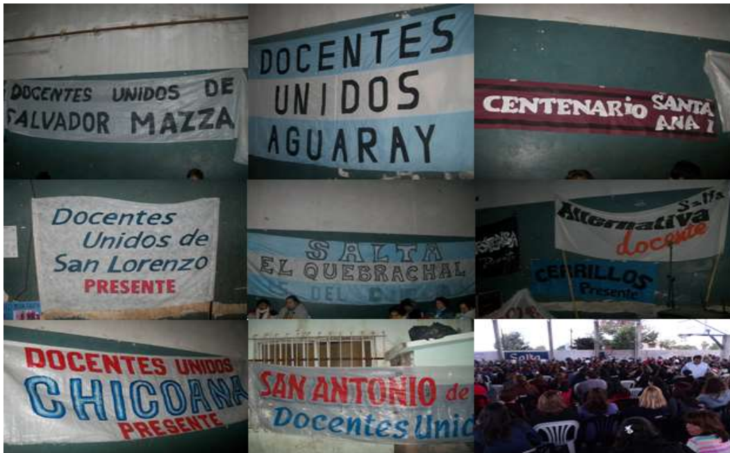
Foto N°10: pancartas y pasacalles, exhibidos en los espacios de realización de asambleas provinciales DUS. Abril 2014.

mociones, discursos por parte de delegadxs de base, etc.) y, entre discursos oídos y prácticas observadas, se reconoció una docencia organizada.