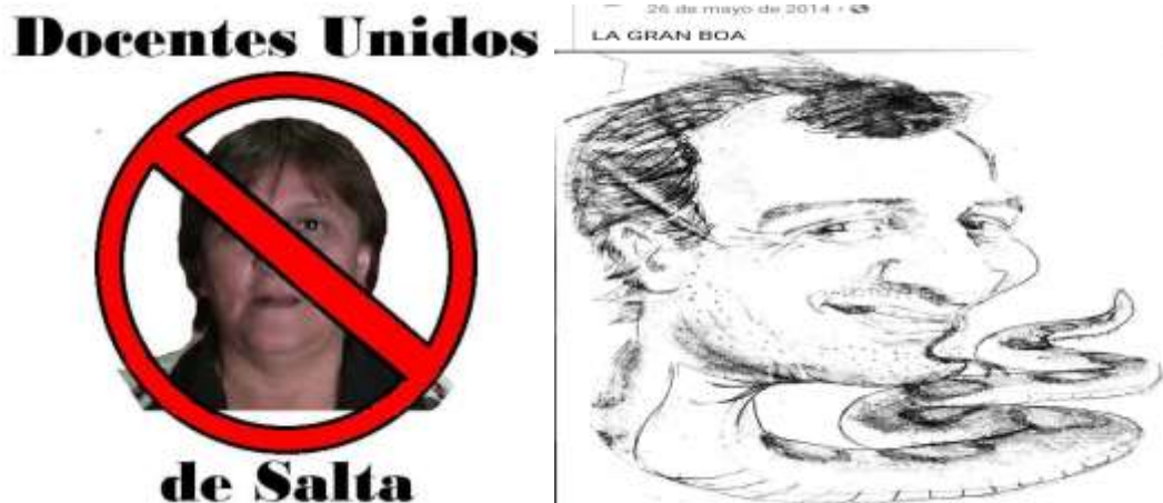
Foto N°5: Imagen y dibujo de ex dirigentes de Docentes autoconvocados, pensados como traidores de la “lucha docente” 2014.

liderados por lxs actores, popularizados a raíz de su participación en las manifestaciones del periodo 2005- 2007.