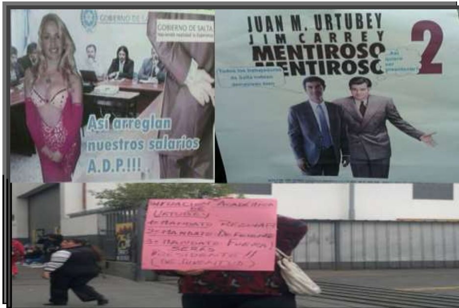
Foto N°18: selección donde se ridiculizan las imágenes del gobernador Urtubey (“mentiroso”) y de la secretaria general del gremio ADP, mostrando a esta última con un vestuario de comparsa. Carteles exhibidos en marchas provinciales. Año 2014.

Ilustrativo de lo planteado, son algunas declaraciones de docentes en las asambleas, concentraciones y marchas, con relación a estos dos blancos de ataque (el gobierno y el gremio), y, de quienes “habría que cuidarse” (empresas periodísticas y partido).