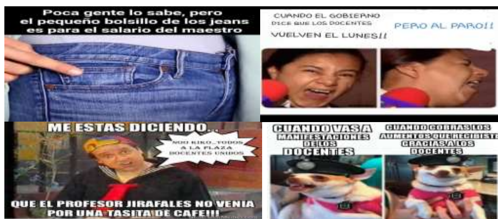
Foto N°17: selección de memes. Marzo- junio 2014.

Expresiones como “lean los perfiles”, “hoy posteamos”, “estamos sumando seguidores en las redes”, “se hará viral”, empezaron a formar parte del lenguaje de lxs profesorxs movilizadxs. Los “memes” y las “selfis” se incorporaron, como novedad, alimentando la dinámica de encuadre en pancartas, carteles y pasacalles, contribuyendo no solo a los perfiles de protagonistas y antagonistas si no, también, satirizar a estos últimos en sus frustrados intentos de hacer declinar a la docencia unida. Ejemplos de esto son los memes, que a continuación se muestran, contribuyendo con el encuadre de una docencia robusta, sin miedo y despreocupada de las “amenazas del gobierno” y fuerza policial: