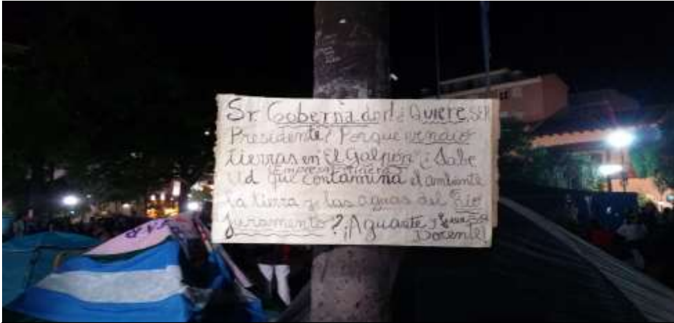
Foto N°7: cartel colgado en el acampe de la plaza “9 de Julio”, abril 2014. se evidencia la intencionalidad del gobernador de ser candidato presidencial y se lo acusa de vender tierras en la localidad de “El Galpón”, departamento Metán.

Vale la pena en este análisis, considerar la expresión “aliados influyentes” bien merecida para el caso de “Docentes Unidos de Salta”. De la misma forma que ocurrió en el período 2005- 2007, en 2014 lxs educadorxs salteñxs vieron en la Iglesia Católica, referentes nacionales de los medios de comunicación, algunxs legisladorxs y el turismo, una posibilidad más de visibilizar el conflicto local y “extender” marcos: