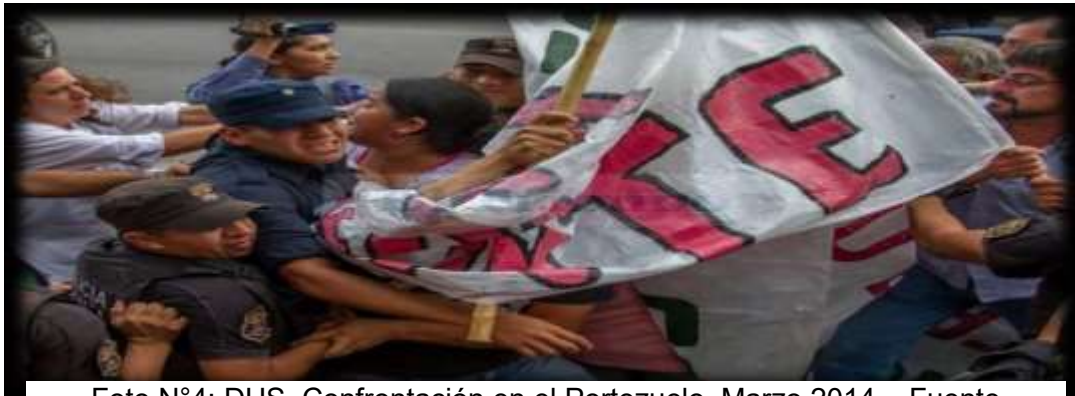
Foto N°4: DUS, Confrontación en el Portezuelo. Marzo 2014 – Fuente Facebook Docentes Unidos de Salta. Año 2014.

500 policías para 200 docentes... la policía encerrando a los docentes. Nos tienen prisioneros a los docentes. Miren. Esa es la policía que tenemos en Salta. Encerrándonos a los docentes. Esto lo vamos a grabar y lo vamos a pasar por Facebook, Por las redes sociales. Que se entere el país de como tratan a la docencia en Salta. Primero nos golpean en el portezuelo, ahora nos encierran en la plaza 73