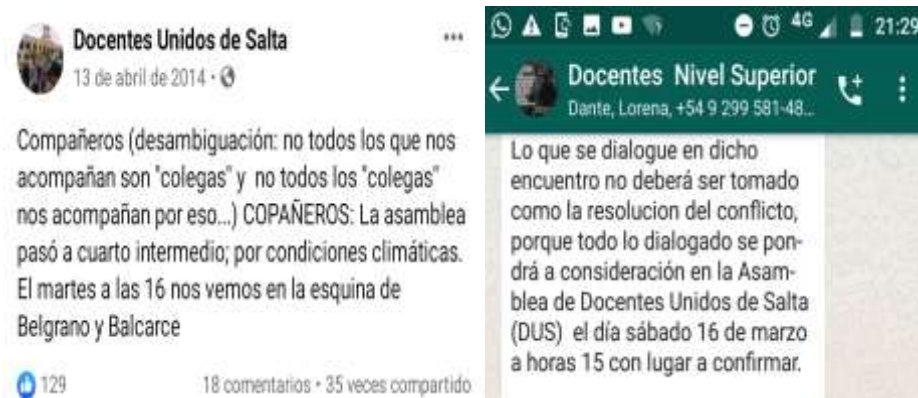
Foto N°16: Docentes Unidxs de Salta en las redes sociales. Facebook y WhatsApp. Año 2014.

Expresiones como “lean los perfiles”, “hoy posteamos”, “estamos sumando seguidores en las redes”, “se hará viral”, empezaron a formar parte del lenguaje de lxs profesorxs movilizadxs. Los “memes” y las “selfis” se incorporaron, como novedad, alimentando la dinámica de encuadre en pancartas, carteles y pasacalles, contribuyendo no solo a los perfiles de protagonistas y antagonistas si no, también, satirizar a estos últimos en sus frustrados intentos de hacer declinar a la docencia unida. Ejemplos de esto son los memes, que a continuación se muestran, contribuyendo con el encuadre de una docencia robusta, sin miedo y despreocupada de las “amenazas del gobierno” y fuerza policial: