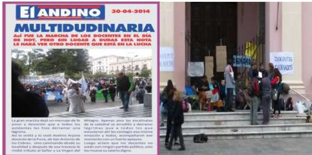
Foto N°14: titular de diario El Andino, recuperando la llegada de docentes de San Antonio de los Cobres a las escalinatas de la Catedral de Salta. Así mismo, fotografía de docentes encadenados y realizando huelga de hambre en el ingreso a la catedral. Año 2014.

relativamente desorganizado, indirecto, asimétrico, sin intencionalidad de instituirse como arma de guerra, permitió poner de relieve un cuestionamiento de la autoridad y una forma de protesta, a un coste menor que otros modos de confrontación directa.