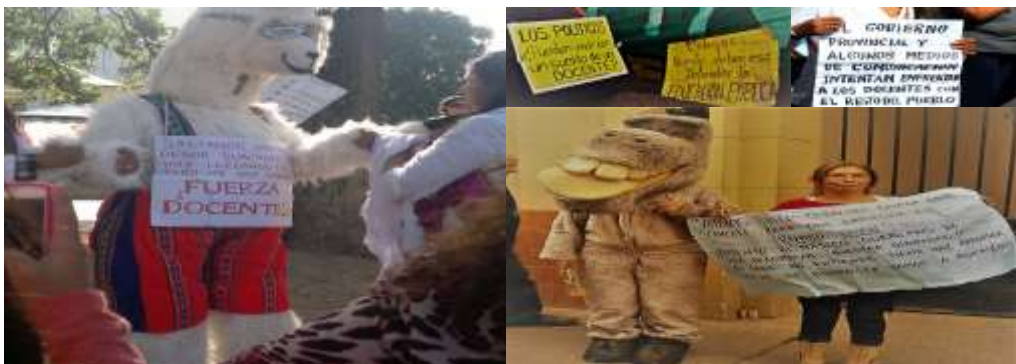
Foto N°15: mascotas de DUS. La “llama de Guachipas” y el “Burro Juan”. Abril 2014.

Las asambleas fueron lugares de riqueza discursiva donde se debatieron diferentes puntos de vista. En las marchas, también, se reconocieron espacios de intercambio y socialización. Los marcos fueron sintetizados y expresados en elaboraciones con la finalidad de atrapar la atención de “las audiencias”: se modificaron letras de conocidos temas musicales, a los fines de ser usados en marchas, cortes y asambleas, produjeron carteles y pancartas, imágenes, dibujos, muñecos, indumentarias y los mismos cuerpos, armonizados entre sí, en el desplazamiento rítmico de la “movida callejera”. Todo cuanto se construyó y usó, en la comprensión del investigador, hace a evidencias observables de las tareas (atribución, articulación y movilización), funciones de enmarcado y contribución con el sostenido proceso de “extensión de marcos”.