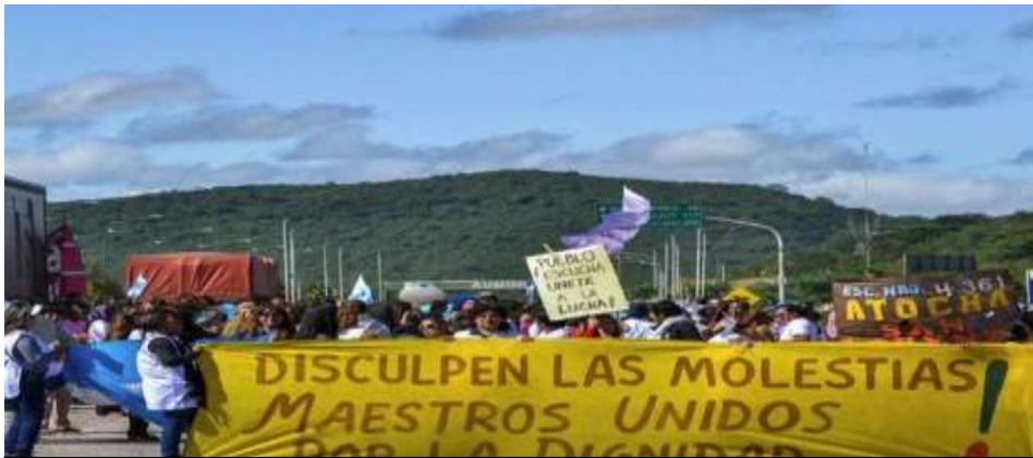
Foto N°1: Docentes Unidos de Salta- Corte de Ruta en AUNOR, acceso a la ciudad de Salta. Abril 2014

Un colectivo pensado como movimiento plural donde se reconocen diferentes tradiciones de lucha: lxs “aguerridos” del norte que saben de cortes de ruta, lxs conciliadores del sector sur, lxs pertenecientes a los valles que elaboran performances resonantes, recuperando costumbres, ritos y rituales de la idiosincrasia en la provincia. También, distintas agrupaciones, algunas relacionadas con el partido justicialista, radicalismo, socialismo, partido obrero, en la provincia. Cada una con sus oradorxs, sus referentes o notables en asambleas y movilizaciones, por las calles de Salta.