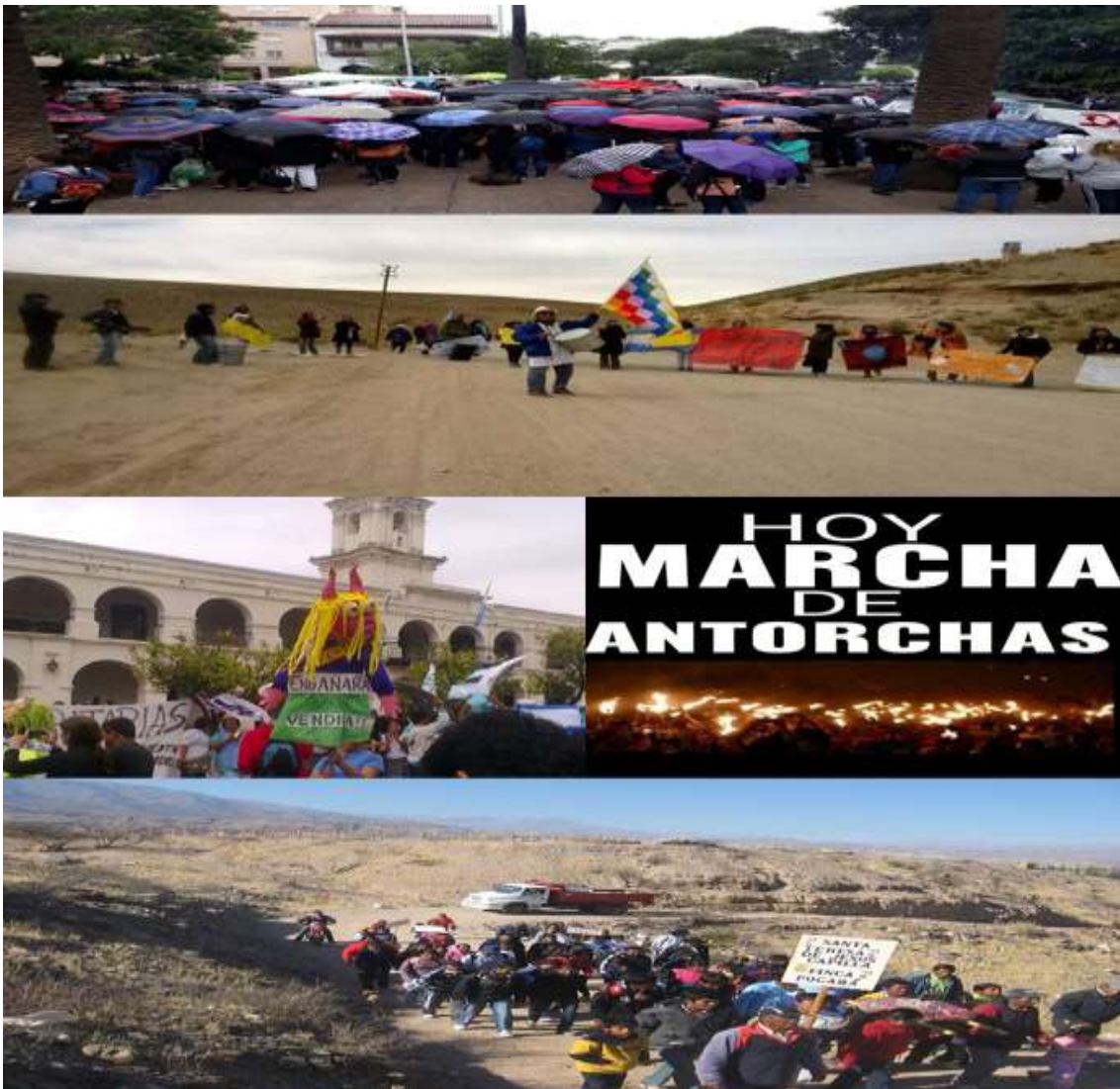
Foto N°9: Diferentes repertorios exhibidos por DUS: marcha de las sombrillas, marcha de antorchas, concentraciones frente al Cabildo Histórico, peregrinaciones. Año 2014.