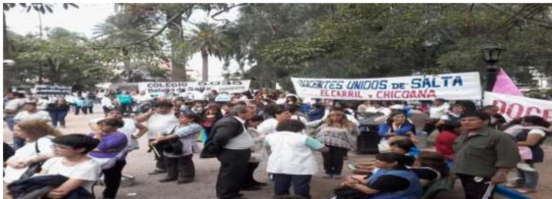
Foto N°2: Docentes Unidos de Salta, concentración en “Plaza 9 de Julio”. Abril 2014.

de experiencias de luchas colectivas por parte del “sujeto social docente” y que, a partir de sus espacios y temporalidades, produce resonancia narrativa, contribuyendo a la movilización del consenso y a un terreno fértil para que se produzca la movilización de la acción.