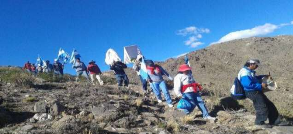
Foto N°12: profesorxs peregrinxs DUS. Peregrinación de docentes San Antonio de los Cobres. Abril 2014.